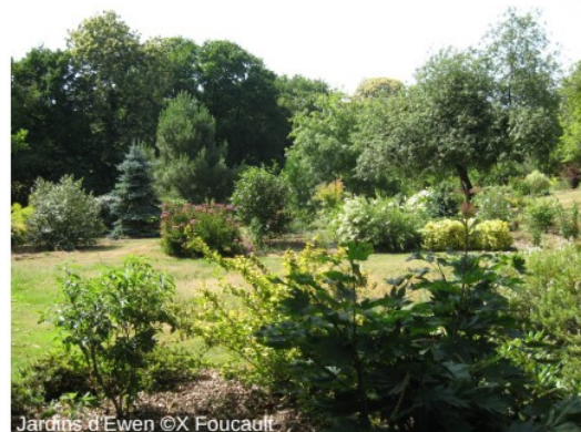
Jardins d'Ewen