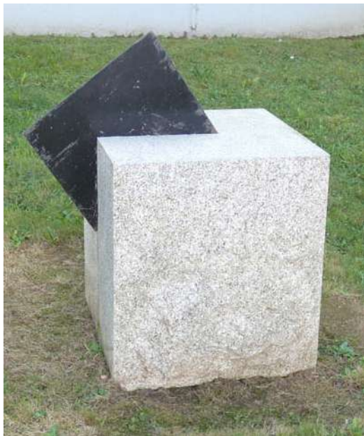
A la demande de l'artiste, une tôle a été peinte en noir.

Vivre le lieu (penser à partir du lieu nature)