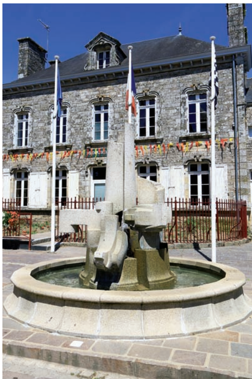
Cette œuvre se situe devant la mairie de Plumelec.

Exposition de groupe : 1988, 1992 Exposition personnelle : 1993